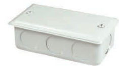
MLSDLBCONNNS - Unpainted MLSDLBCONNWSW - Painted